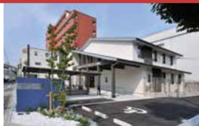
かんたき上新庄 (大阪市東淀川区)