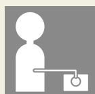
膀胱留置カテーテル