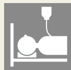
中心静脈栄養管理