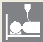
中心静脈栄養管理